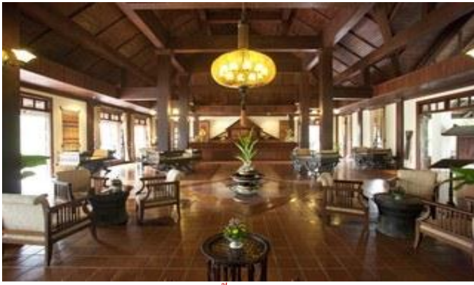
บรรยากาศในล็อบบี้ของ Santi Resort & Spa