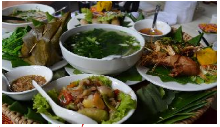
อาหารต้อนรับมือกลางวันของ Santi Resort & Spa